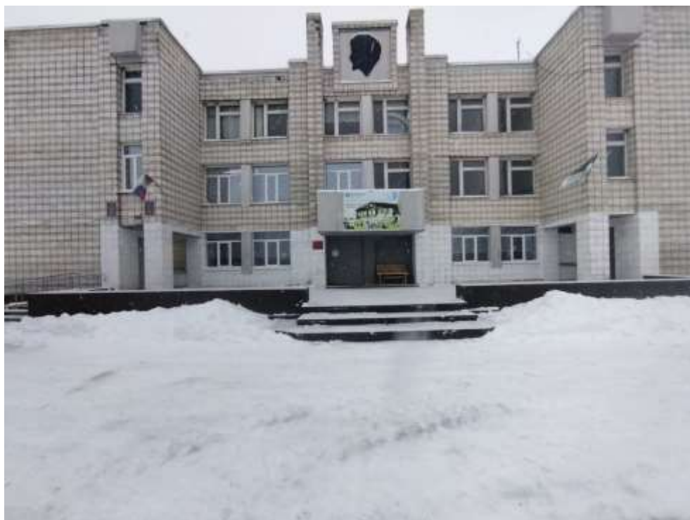
Центральный вход в дом культуры